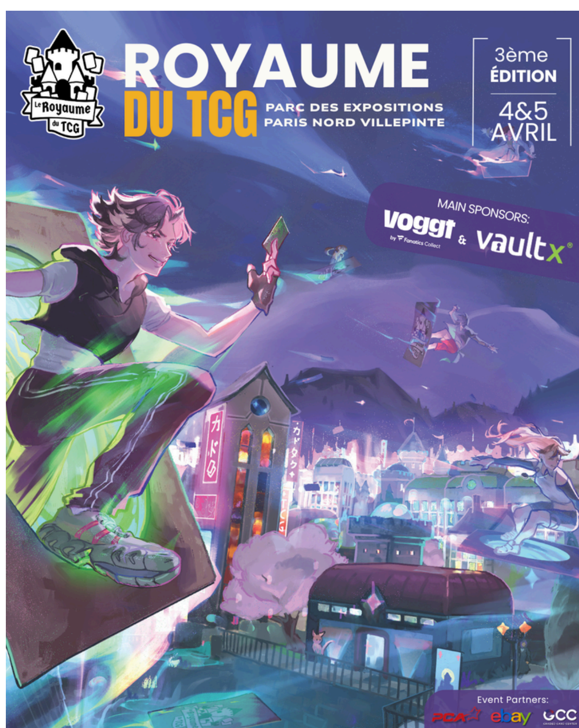
Affiche officielle de la 3 ème édition du Royaume du TCG

Paris, le 16 février 2026 – La plus grande convention de jeux de cartes à collectionner d'Europe, le Royaume du TCG , aura lieu les 4 et 5 avril au Parc des Expositions de Paris Nord Villepinte. Ce temps fort de la culture TCG (Trading Card Games) rassemblera les joueurs compétitifs et les collectionneurs passionnés dans un lieu de rencontres, d'échanges et de découvertes. Pendant 2 jours, les visiteurs plongeront dans l'univers des TCG et profiteront d'un programme riche et varié avec plus de 100 exposants.